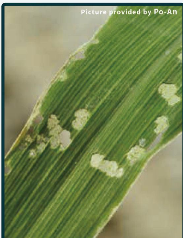
1齡幼蟲造成透明窗格紋啃食痕跡