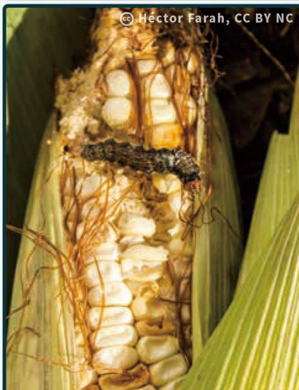
老熟幼蟲啃食玉米穗