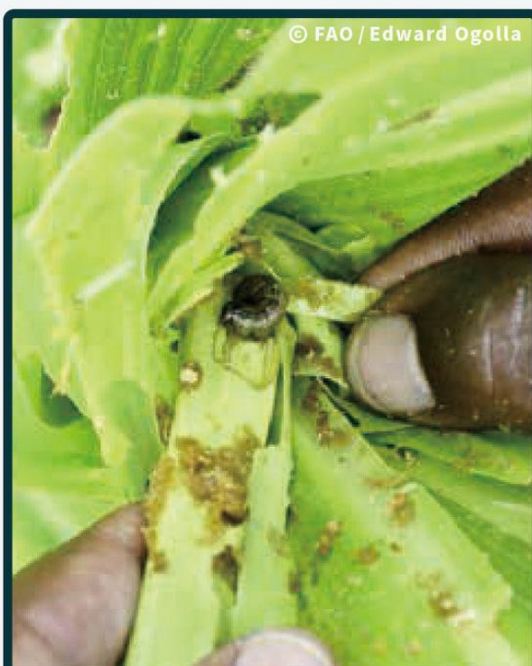
偏好啃食作物生長點，受害處留下大量糞便