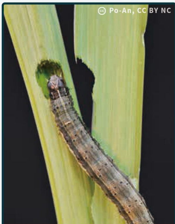
老熟幼蟲蛀食莖桿