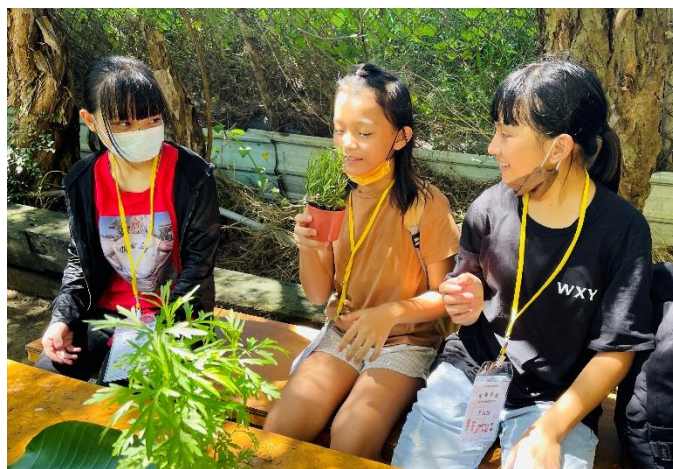
課程內容依學員學習狀況調整