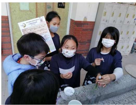
課程內容依學員學習狀況調整