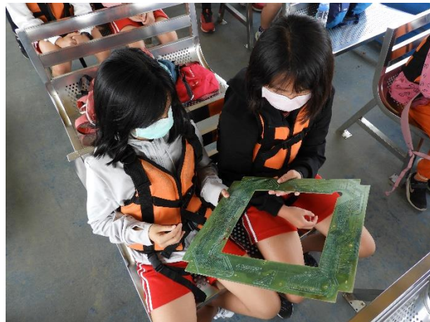
課程內容依學員學習狀況調整