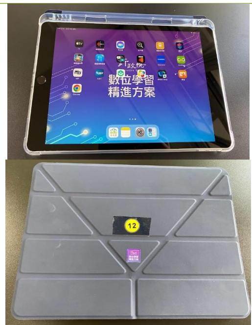
iPad 9 th