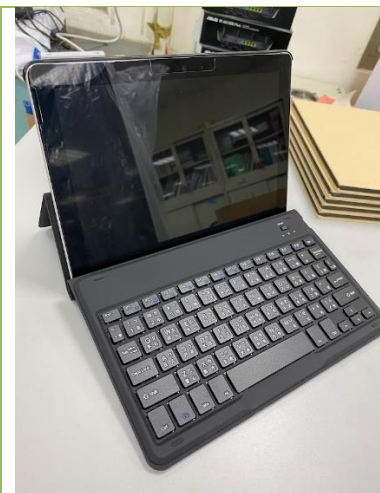
Surface Go 1 th 鍵盤保護皮套為藍芽連接， 使用前請務必充電。