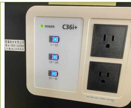
圓剛C36i 充電車 通電後充電車面板會自動檢測並顯示充電狀態。