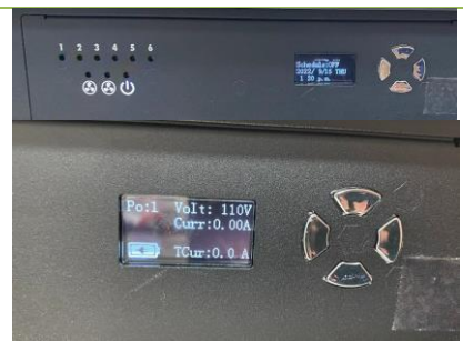
金恩SEN30-K 充電車 通電后面板會亮起，電源、各區充電燈 與風扇運作時會亮燈。 ※請勿任意調整充電排程。