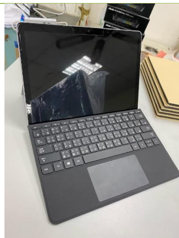
Surface Go 2 th 原廠鍵盤為磁吸式連接， 使用時請小心避免掉落， 若有輸入異常請將平板與鍵盤 分離後重新連接或重新開機。