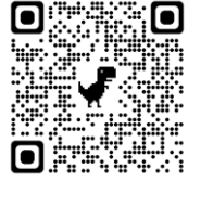
3. 確認是否報名成功