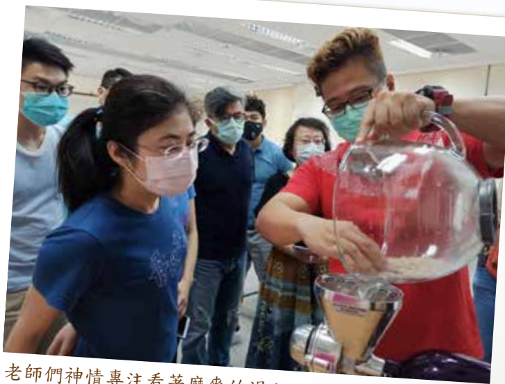
老師們神情專注看著磨麥的過程