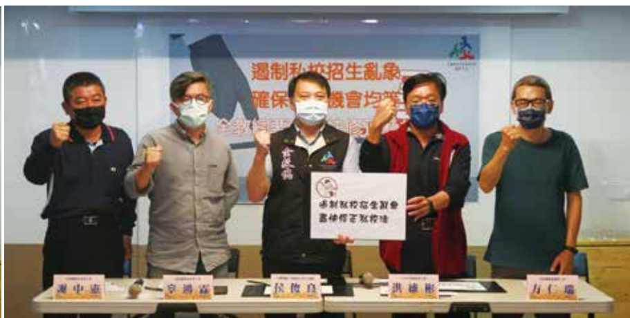
全教總理事長與中部各縣市工會理事長聯合召開記者會