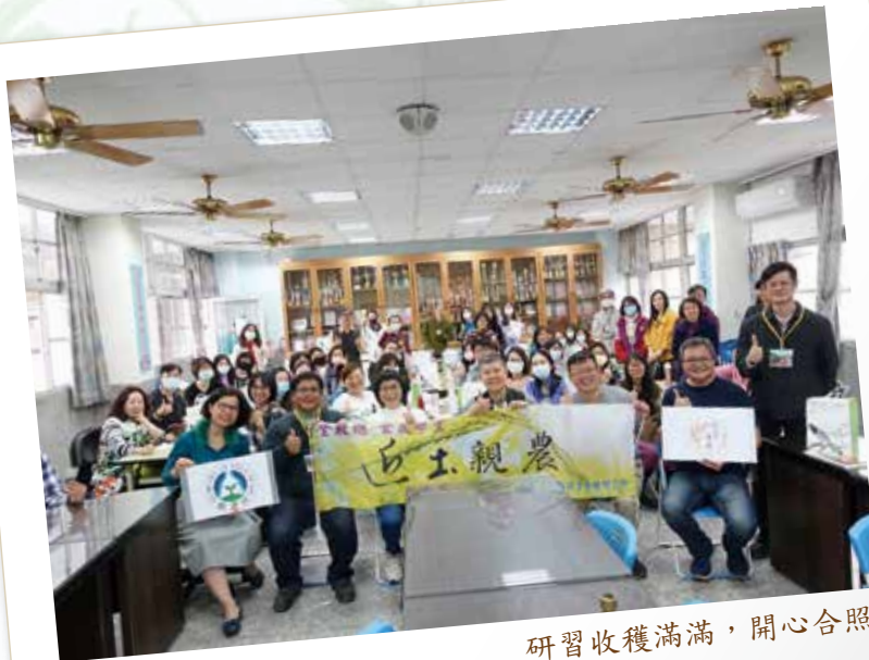
研習收穫滿滿，開心合照

這麼精采的研習，三月份又將展開新年度的巡迴場次，不漏接的方法之一：關注全教總及食農學堂粉專；之二：不定時到全教總官網食農學堂專區逛逛；之三：在「全國教師在職進修資訊網」搜尋「近土親農-食農學堂」，都能找到您距離食農教育最近的研習場次喔！