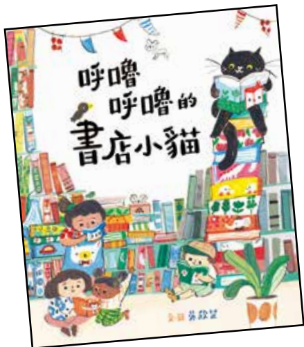
呼嚕呼嚕書店小貓