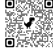
3.確認是否報名成功