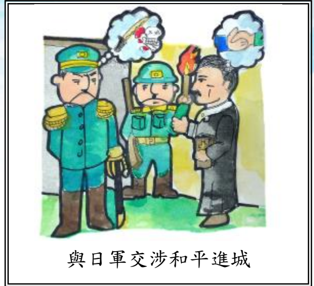
與日軍交涉和平進城