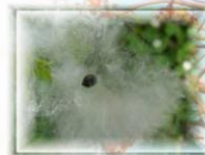
斑芝樹的棉絮與種子