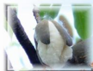
裂開的斑芝樹果實