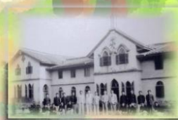
臺灣第一所大學 (台南神學院)