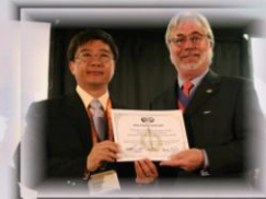
巴克禮紀念公園榮獲 全球傑出建築金獎