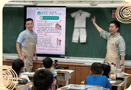
志工透過教具教小朋友 如何摺衣服