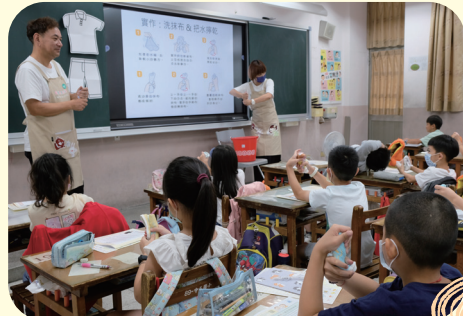
實作課程帶領小朋友 學會擰抹布、擦桌子