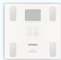
藍牙體重體脂計3名