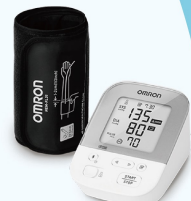
藍牙電子血壓計3名