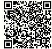
遴選委員 登記表單