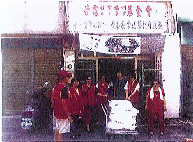
資助老人，身心障礙者，送餐到府服務。