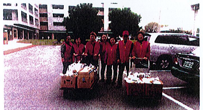
惠明盲校全體小朋友，通通有獎勵品