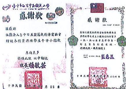
鼓勵資源班的同學獎勵品。 獲各級學校的感謝狀~