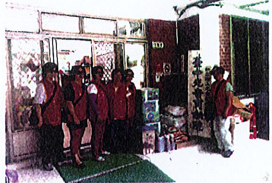
於台中光普育幼院，資助生活必需品。