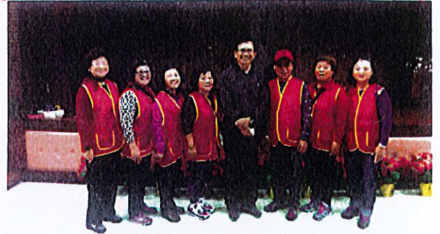
於惠明盲校與校長合影。