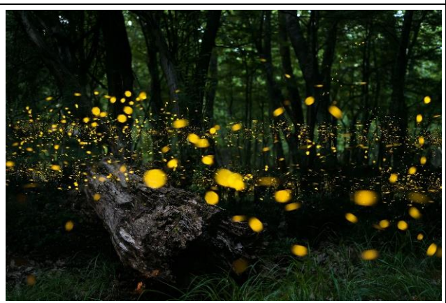
尖山埤螢火蟲棲地夜觀