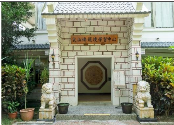
尖山埤環境學習中心