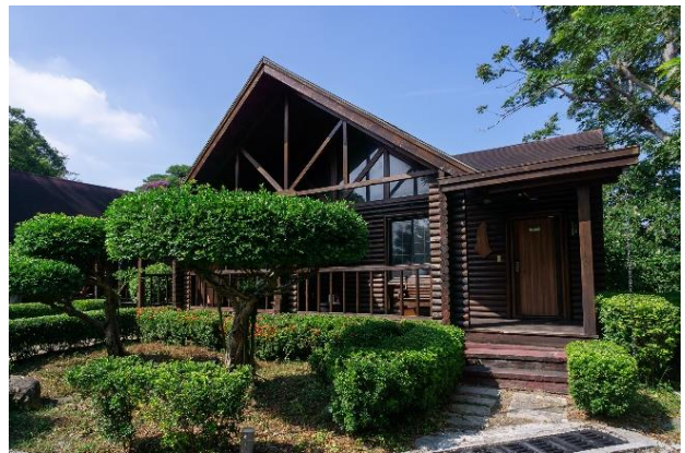
尖山埤小木屋-環保旅店