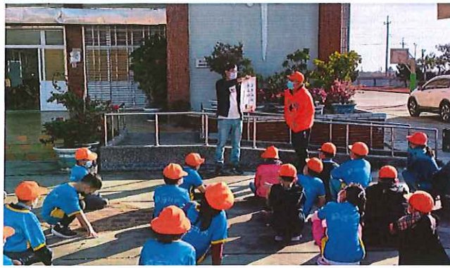
說明：制定週一母語日-兒童朝會宣導