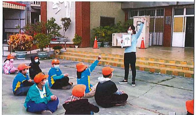
說明：制定週一母語日-兒童朝會宣導