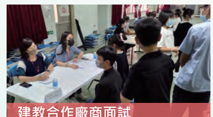
建教合作廠商面試