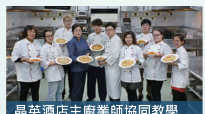
晶英酒店主廚業師協同教學