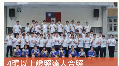
4張以上證照達人合照