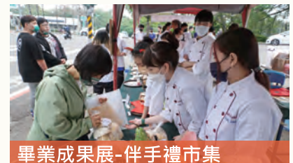
畢業成果展-伴手禮市集