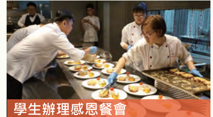
學生辦理感恩餐會