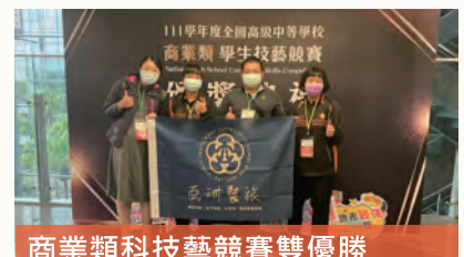
商業類科技藝競賽雙優勝